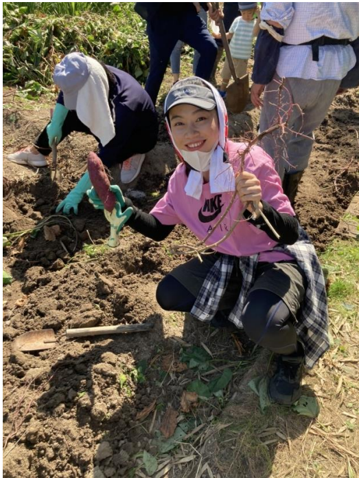
=サツマイモの収穫=