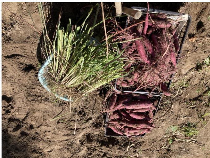
=レモングラスとサツマイモ=