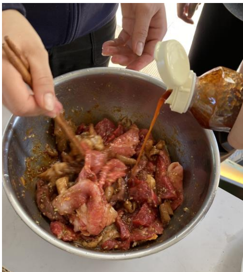
=レモングラスと焼き肉=

か、みじん切りにして焼肉にたれと一緒に混ぜ込みました。そして網焼き。経験のない焼肉にみんな（といっても日本人ですが）舌鼓を打っていました。レモングラスはいま